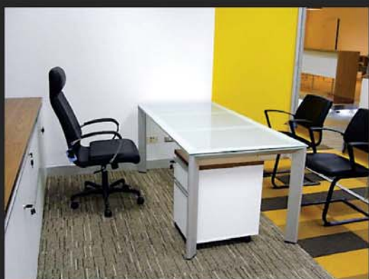
ภาพโต๊ะทำงานที่มีสภาพโปร่ง รวมถึงเก้าอี้หน้าโต๊ะทำงานที่มีขาโปร่งเช่นเดียวกัน ทำให้กระแสไหลเวียนมาถึงผู้นั่งโต๊ะได้ โดยห้องมีแสงสว่างเพียงพอและตำแหน่งนั่งหันหน้าสามารถมองเห็นคนเข้าออกห้องได้ดี

5) โต๊ะทำงานที่ติดกับบริเวณขาโต๊ะไม่ควรทึบตัน เนื่องจากหลักการของฮวงจุ้ยจะพิจารณากระแสพลังงานเป็นหลัก ซึ่งกระแสพลังงานนี้ก็มาจากช่องประตู หน้าต่าง แอร์ที่มีลมหรืออากาศเคลื่อนไหว หรือแม้แต่ตัวคนที่เคลื่อนไหวเดินเข้ามาที่โต๊ะทำงานก็สามารถลดทอนกระแสพลังงานอ่อนๆ หรือลมอ่อนๆ เข้ามาได้เช่นกัน ซึ่งหากโต๊ะมีขาที่บดบังพลังงานเหล่านี้มาสู่ตำแหน่งเก้าอี้ทำให้ได้รับกระแสพลังงานน้อยลง ดังนั้นโต๊ะทำงานควรมีสภาพโปร่งเพียงพอ เพื่อให้กระแสพลังงานผ่านเข้ามาถึงคนนั่งได้ ส่วนโต๊ะที่สภาพที่บดบังนั้นอาจพิจารณาใช้งานเป็นบางกรณีก็เสริมเป็นฮวงจุ้ยที่ดีได้