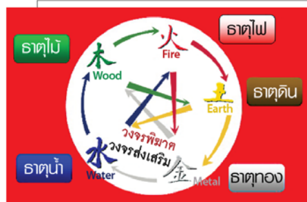
รูปวงจรปฏิทิน 5 ธาตุ

การใช้สีขององค์ประกอบฮวงจุ้ยจะพิจารณาสีให้สอดคล้องกับพลังงานในแต่ละองค์ประกอบเพื่อไปกระตุ้นพลังงานที่ดีให้ดียิ่งขึ้น เช่น หากคำนวณองค์ประกอบแล้วก็ได้มีปรากฏธาตุไฟที่ตีความว่าใช้สีของธาตุไฟหรือสีของธาตุไม้ในบริเวณนั้น เนื่องจากสีธาตุไฟ (สีแดง ม่วงแดง ชมพู) เป็นสีพลังงานลักษณะเดียวกับปรากฏพลังงานธาตุไฟจึงส่งเสริมปรากฏพลังงานธาตุไฟให้มีพลังมากขึ้น ส่วนสีของธาตุไม้ซึ่งปกติแล้วธาตุไม้เป็นธาตุที่ก่อเกิดธาตุไฟให้กำลังมากขึ้นเหมือนไม้เป็นเชื้อเพลิง ดังนั้นหากใช้สีของธาตุไม้ (สีเขียว) ก็จะช่วยกระตุ้นพลังงานธาตุไฟให้กำลังมากขึ้นเช่นกัน ซึ่งการยกตัวอย่างนี้เป็นรายละเอียดคร่าวๆ นอกจากนี้ยังเลือกใช้สีสอดคล้องกับธาตุที่ร้ายให้ร้ายน้อยลงในแต่ละองค์ประกอบได้อีกด้วย ซึ่งแท้จริงหลักการใช้นั้นอ้างอิงถึงหลักตามปฏิทิน 5 ธาตุ ที่มีความสัมพันธ์ของแต่ละธาตุต่างกัน โดยบางธาตุก่อเกิดพลังให้บางธาตุ บางธาตุทำลายพลังงานของบางธาตุ และบางธาตุพิฆาตควบคุมบางธาตุนั่นเอง